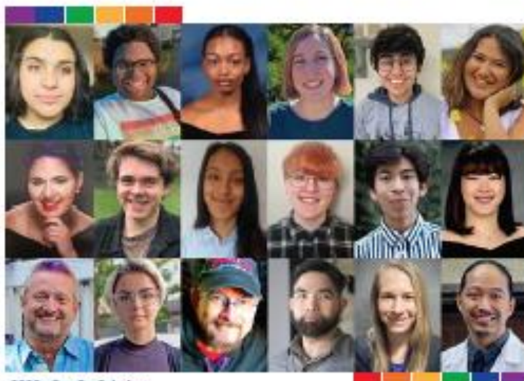
2020 eQuality Scholars